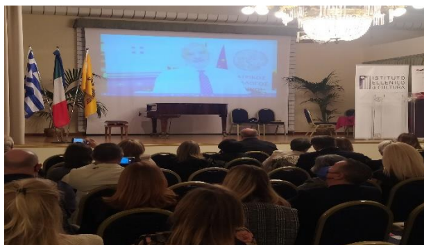
ο Περιφερειάρχης Αττικής κ. Γεώργιος Πατούλης