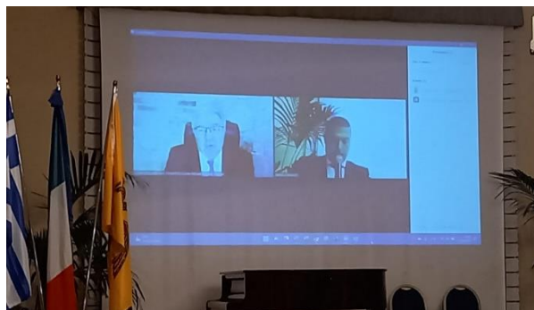
Ο Γενικός Γραμματέας Απόδημου Ελληνισμού και Δημόσιας Διπλωματίας του Υπουργείου Εξωτερικών της Ελλάδας, κ. Ιωάννης Χρυσουλάκης