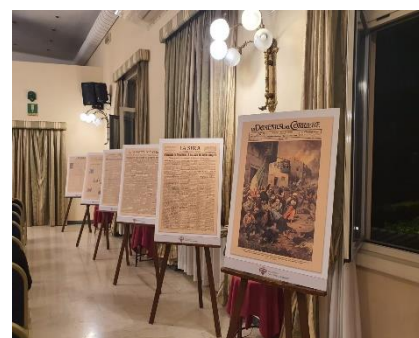
Η εκδήλωσή πραγματοποιήθηκε στον φιλόξενο χώρο του Circolo Alessandro Volta στο Μιλάνο